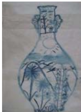
呂楚翹 十歲 美術作品