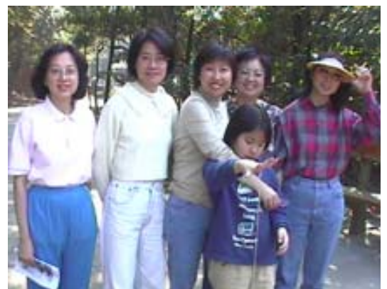
聖十字架堂組 燒烤樂