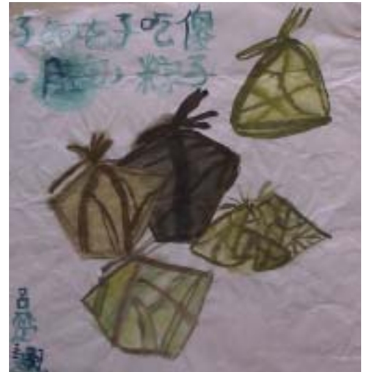
呂楚翹 十歲 美勞作品 (糉)