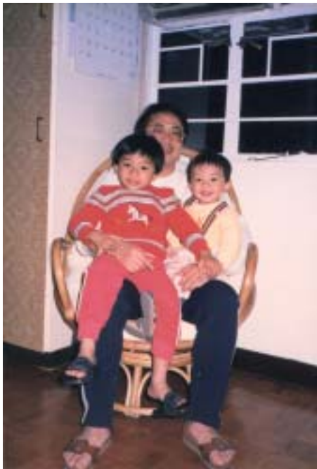
真舒服！可以在爸爸的懷中歎世界！