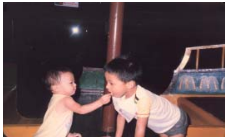
弟：咪話我孤寒，請條薯條你食啦，好味嗎？