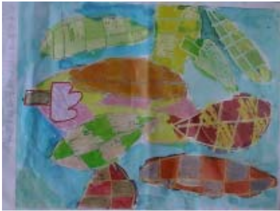
廖嘉曜 十二歲 秋天的葉