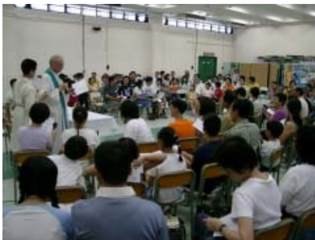
恩神父正在講道，大家都聽得津津有味。