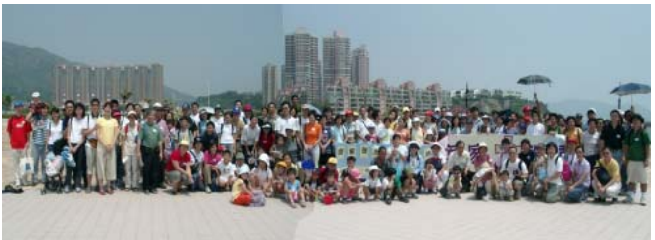
你認為這場面墟坎嗎？