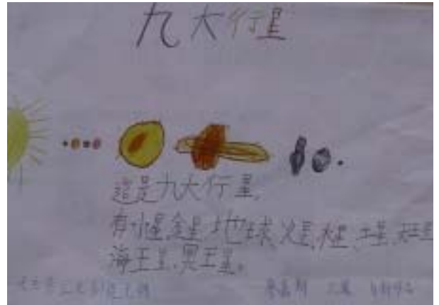
廖嘉朗 六歲 九大行星