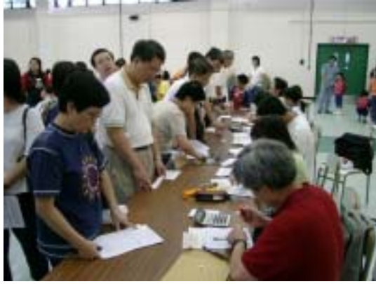
左圖： 工作人員正 忙於收集籌 得的善款