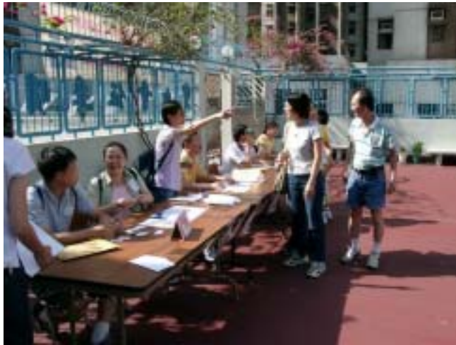
工作人員正開始登記