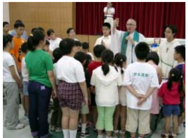
小朋友都湧到神父面前參與感恩祭